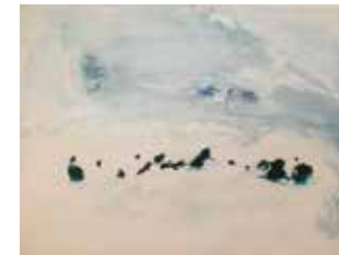
Véro Leduc, Au nord du silence , détail, 2012

Jusqu'au 12 janvier 2020, du dimanche au samedi, aux heures d'ouverture de la bibliothèque